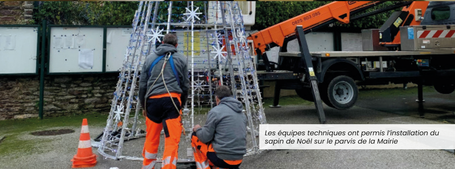
Les équipes techniques ont permis l'installation du sapin de Noël sur le parvis de la Mairie