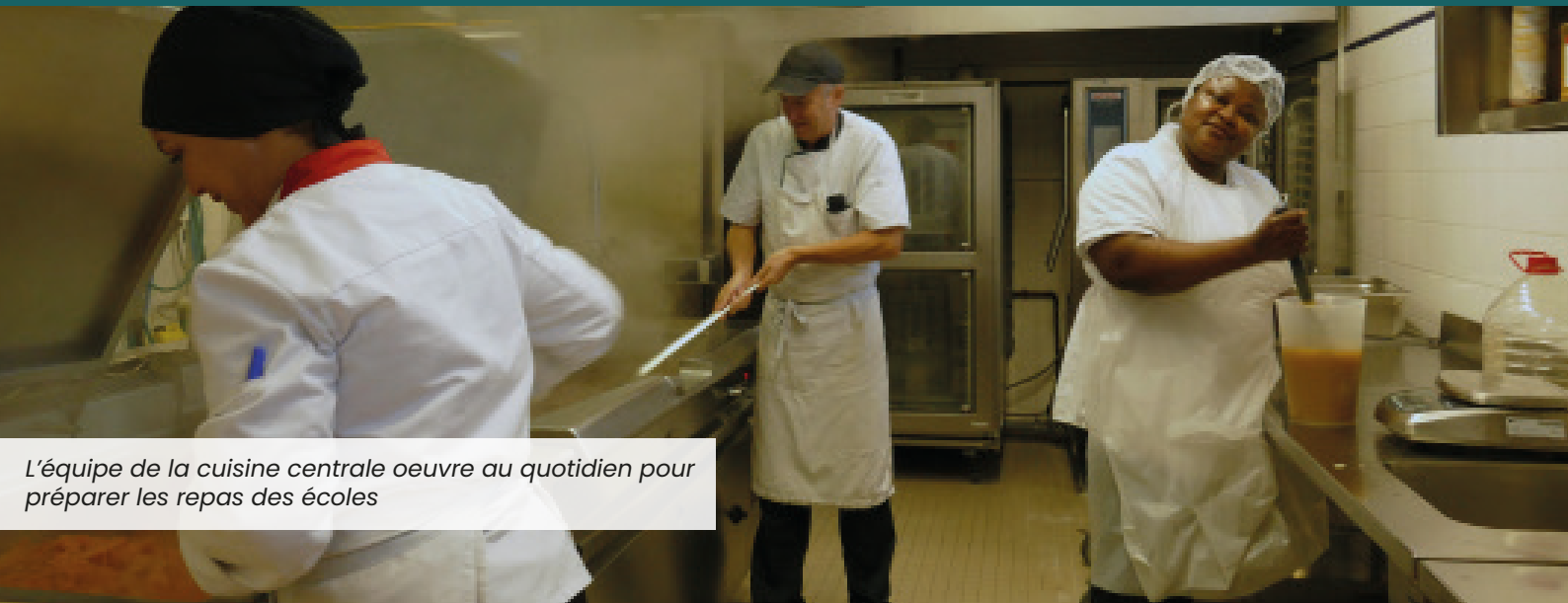
L'équipe de la cuisine centrale oeuvre au quotidien pour préparer les repas des écoles