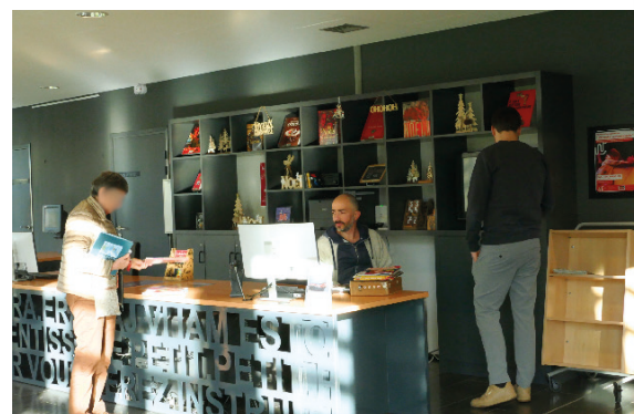
L'équipe de la Médiathèque vous accueille et propose de nombreux temps forts culturels

La Médiathèque, les équipements sportifs et événements locaux reposent sur des équipes dédiées. Agent-e-s de médiathèque, chargé-e-s-n de développement culturel et de la vie associative... : ils-elles contribuent fortement à la vie sociale et culturelle de la commune, pour tous les âges.